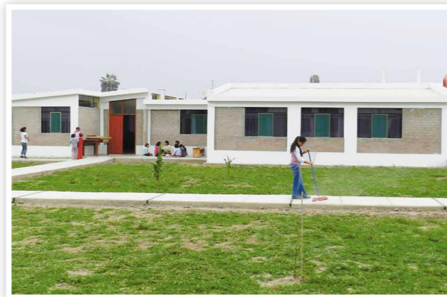
Die neuen Häuser im Kinderdorf in Peru

Dank der Gelder aus Vermächtnissen können wir Ihnen von einer Erfolgsgeschichte aus Peru berichten. Seit Oktober 2011 haben unsere Schützlinge ein neues Zuhause. Davor lebten wir sieben Jahre in gemieteten Gebäuden. Das neue Kinderdorf hat momentan sechs Wohnhäuser für je 16 Kinder. Eines davon wurde mit Geldern aus Vermächtnissen finanziert. Da wir insgesamt bis zu 500 Kinder bei uns aufnehmen möchten, besteht noch großer Finanzierungsbedarf in den nächsten Jahren. Neben weiteren Wohnhäusern wollen wir u.a. eine eigene Schule und Klinik bauen. Zurzeit sind die Krankenstation und Therapieräume in einem provisorischen Container untergebracht. Die Kinder und Betreuer sind sehr glücklich über ihr neues Zuhause und danken allen Freunden für die Unterstützung. Natürlich freuen wir uns auch, wenn neue Unterstützer für den Ausbau des Kinderdorfs in Peru dazu kommen.