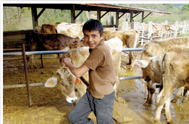
Unsere Landwirtschaftsprojekte – ein nachhaltiges Konzept

Auch im Bereich Medizin/Gesundheit können Sie mit einem Vermächtnis viel Gutes bewirken. Der Bedarf ist enorm, da viele Mädchen und Jungen unterernährt, geschwächt oder krank zu uns kommen. Die Kinder werden regelmäßig untersucht und von nph -eigenen Fachkräften betreut. In Einzelfällen ermöglichen wir auch Spezialbehandlungen im Ausland. Hier kann Ihre Unterstützung Leben retten. Wichtig für die gesunde Entwicklung unserer